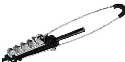
کلمپ کششی گوه ای ریختگی